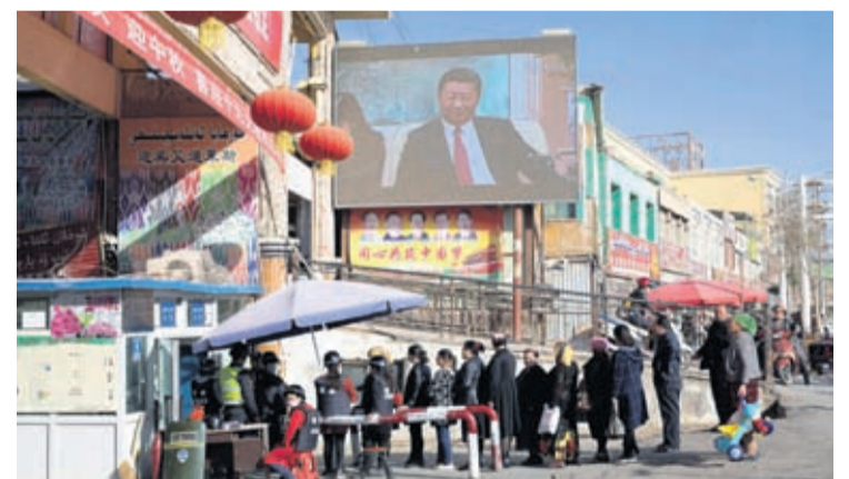
In this Nov. 3, 2017, file photo, residents line up at a security checkpoint into the Hotan Bazaar where a screen shows Chinese President Xi Jinping in Hotan in western China's Xinjiang region.

Veterans of the camps and family members say those held are forced, often with the threat of violence, to denounce their religion, culture and language and swear loyalty to Communist Party leader and head of state Xi Jinping.